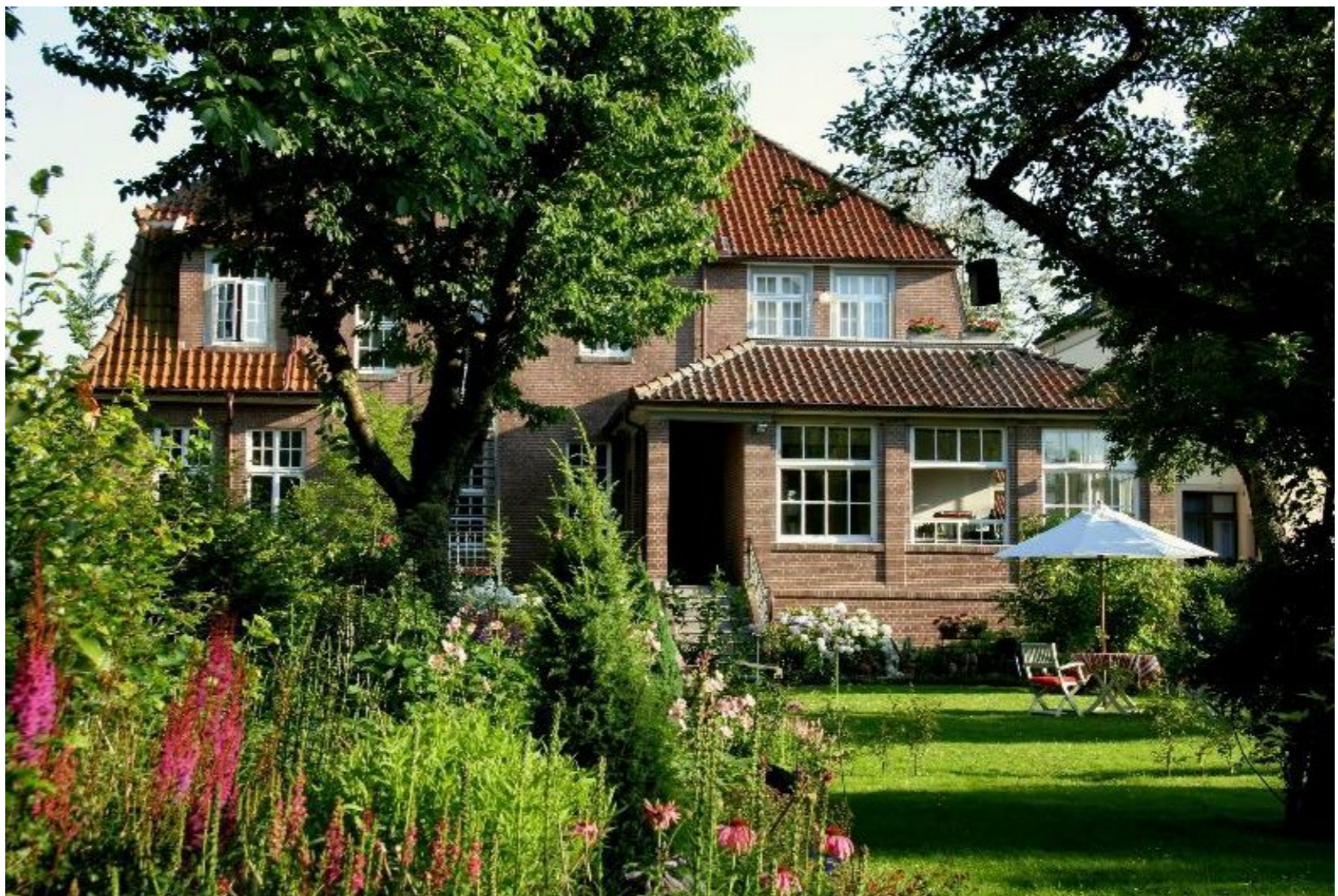
Die rote Backstein-Villa hat einen schönen Garten

schönen Rosenstöcken und Obstbüschen ein und die Marmelade auf dem Frühstückstisch stammt von Früchten aus dem Garten. Leer im südlichen Ostfriesland bezeichnet sich zu Recht als das „Tor Ostfrieslands“. Von Süden, Osten oder Westen kommend, passiert man stets diese hübsche Kleinstadt. Viele kleine Geschäfte bereichern die Altstadt, Lädenketten sucht man hier vergebens. Und Leer ist auch Sitz eines großen ostfriesischen Teehauses. In einem kleinen Tee-museum wird vieles über Tee und die